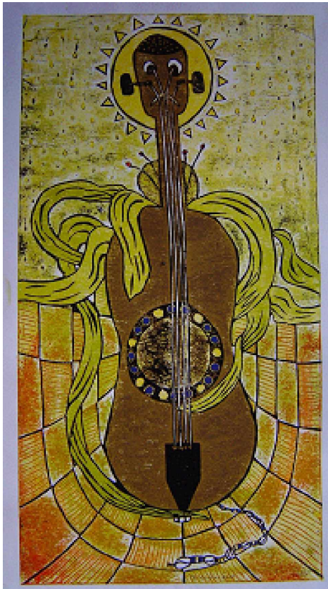
Innocent Rhythm – Rhythmus der Unschuld

Den Durchbruch zur Berufsentscheidung brachte ein Kursus von zwei Wochen im Franco Namibian Cultural Centre, wobei Schmuckkästchen entworfen wurden. Der Direktor wurde auf Wallo aufmerksam und empfahl ihm eine dreijährige Kunstausbildung im John-Muafangejo-Zentrum. Obwohl er sehr sparen musste, zog er die Ausbildung durch. Er konnte bei einem Cousin wohnen und hatte nebenbei als Taxifahrer die Möglichkeit, etwas zu verdienen. Es ist für die Herero selbstverständlich, dass Künstler in der Familie versorgt und unterstützt werden, wenn es die Umstände verlangen. Heute ist er soweit, dass er durch die Teilnahme an Ausstellungen seine Bilder gut verkaufen kann, meist an Ausländer. Auch im Unterrichtsbereich scheinen die Bedingungen günstiger zu werden. Andererseits lässt er durchblicken, dass ihm große Reichtümer nicht wichtig sind. Er würde sie lieber weitergeben an Bedürftige.