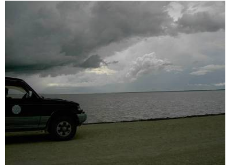
Fisher Pan – Etosha Park

Unterwegs Bedrückend, finster und dunkel Umgeben von Sorgen, Ängsten und Trauer