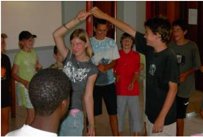
Fotos vom Landesjugend-camp 2006